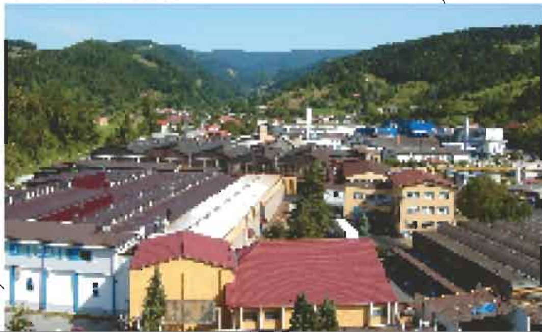
Pogled na UNIOR d.d., v ozadju Rogla.