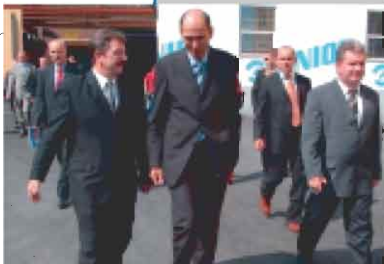
Predsednik vlade RS gospod Janez Janša in minister za gospodarstvo gospod Andrej Vizjak z vodstvom družbe UNIOR d.d.